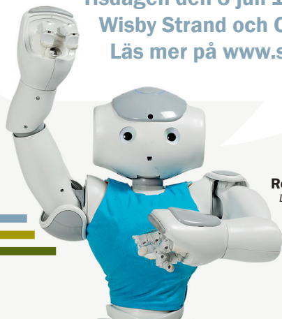
Roboten Elsa Linköpings universitet

Tisdagen den 3 juli 13:00 - 14:30 Wisby Strand och Congress, Ljosta 2 Läs mer på www.strategiska.se